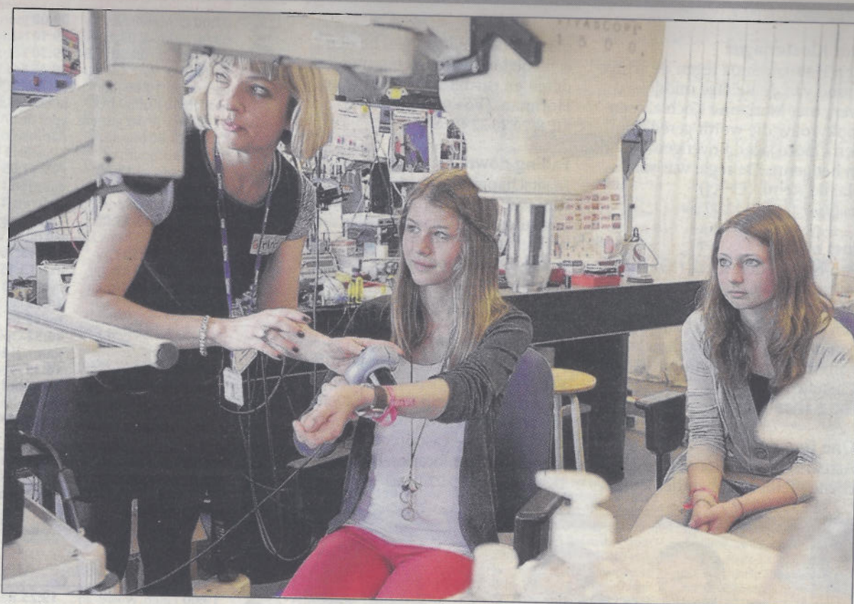
Om de interesse van meisjes en vrouwen in techniek te stimuleren hield Philips de Girlsday op de High Tech Campus in Eindhoven.

werk hoeft te zijn”, zegt zijn collega Ursula Kose van Philips Healthcare. Zij werkt aan een softwaresysteem waarmee artsen beelden van MRI-, röntgen- en geluidsgolfsystemen tegelijkertijd kunnen raadplegen. „Parttime werken is meestal geen probleem. Waarom weinig vrouwen tot de techniek doordringen? Misschien heeft het te maken met voorkeuren die van thuis uit opgedrongen worden.” Om de vooroordelen vroeg weg te nemen, werkt Philips gisteren en vandaag mee aan het Girlsday-initiatief, dat gericht is op meisjes van tien tot vijftien jaar en hun moeders. ASML ontvangt zaterdag in totaal zeventien meisjes. Medewerkers van de chipmachinefabrikant leggen hen onder meer uit hoe de halfgeleidermachines worden geproduceerd.